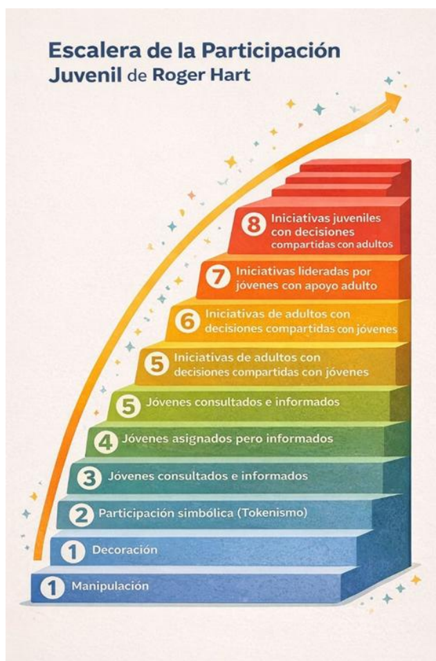
Gráfica de la escala Hart, R. (1992). Children's participation: From tokenism to citizenship. UNICEF.

La Teoría de Hart, que plantea una escala de participación que se cataloga así: