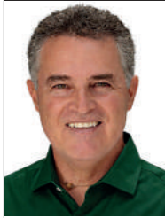
ANIBAL GAVIRIA CORREA