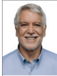
ENRIQUE PEÑALOSA LONDOÑO